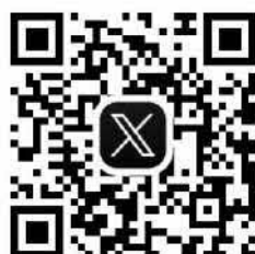
X (旧 Twitter)