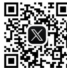
X (旧 Twitter)