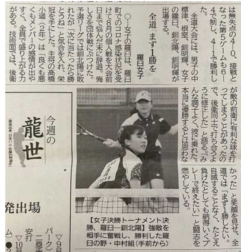
↑ 釧路新聞 令和3年10月5日朝刊