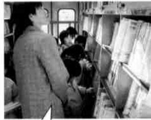
「校長先生、これおもしろいんだよ」 いっしょがうれしい子ども達 春松小で