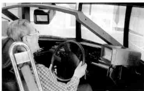
老人クラブ連合会では、ドライブシミュレーションで、交通安全を再確認しました