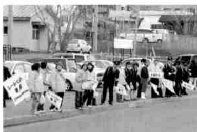
春の交通安全街頭啓発には、たくさんの町民に協力を、頂きました

悲惨な交通事故の加害者・被害者にならないよう、一人ひとりが交通ルールを守りましょう。