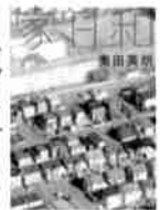
「家日和」 奥田英朗著

ネットオークションにハマる奥さんや、専業主夫になつた旦那さんなどそれぞれの家庭や家族の日常を舞台に描く6つの短編集