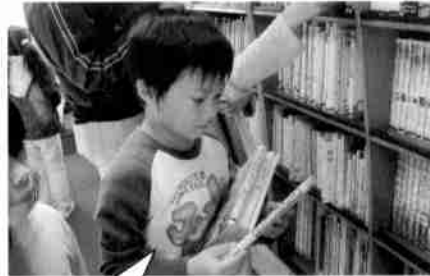
「どの本にしようかなあ」 飛仁帯小で

図書館バスかもめ号は、誰でも無料で本が借りられます。「かもめ号」は誰もが平等に学ぶ機会を町が保障するシンボルです。町の未来を託す子どもたちの育ちを見守っています。