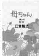
「母ちゃんオンナ」 江宮隆之著

ネットオークションにハマる奥さんや、専業主夫になつた旦那さんなどそれぞれの家庭や家族の日常を舞台に描く6つの短編集