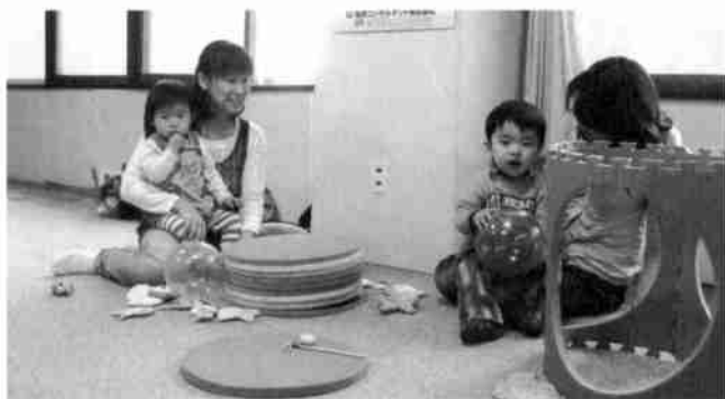
同サークルの取り組みの一つ「ひだまりひろば」での様子

公民館を訪れるお母さんがたから、こんな言葉を聞くことがあります。近年、核家族化や女性の社会進出、少子高齢化など、子育てを取り巻く環境は時代とともに変化しています。そんな時代の変化に対応すべく、最近よく耳にするようになった「子育て支援」とはどのようなものなのでしょう。羅臼町公民館で、定期的開催されている子育て支援サークル「すまいる」の取り組みの様子にお邪魔してみました。