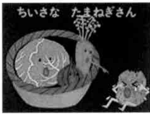
「ちいさなたまねぎさん」 せなけいこ作

子どもの興味や関心に合った本をみつけ、出会わせてあげる事が読書への扉を開きます。多くの中から本を探し出すのは大変。司書にお尋ね下さい。