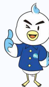
海しるのマスコットキャラクター 「うみしる」

特になし。当日は海しる操作用のノートパソコンをグループごとに用意しますが、操作端末(タブレット、スマートフォン等)を持ち込んでもOKです。