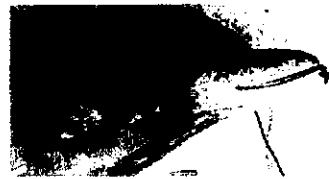
口の周辺に既知の2種と異なる特徴があるクロツチクジラ