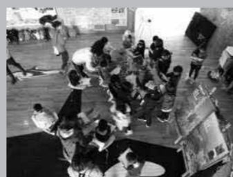
▲子供たちが将来の森をイメージしてスケッチをおこなう様子。(2017年)