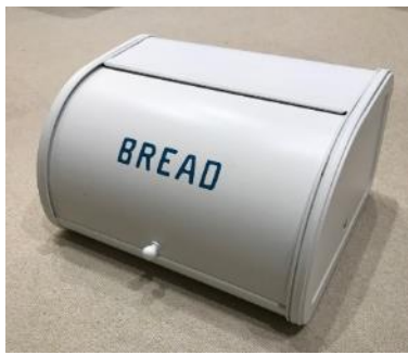
ブレッドケース(小物入れ)