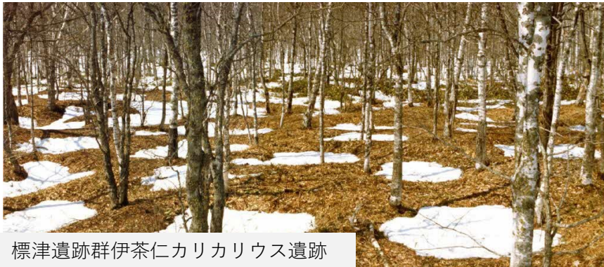
標津遺跡群伊茶仁カリカリウス遺跡