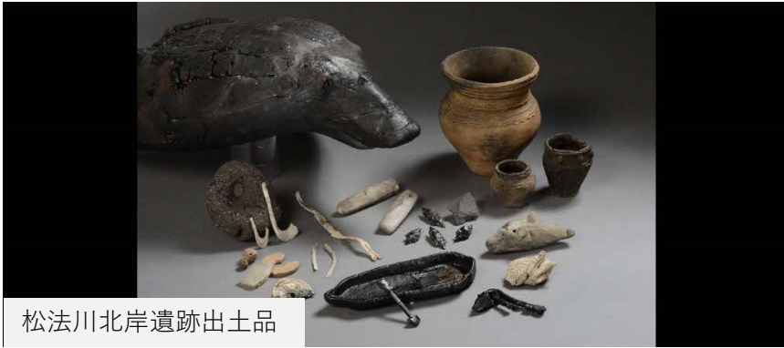
松法川北岸遺跡出土品

令和二年六月十九日に日本遺産に認定となった 標津町、根室市、別海町、羅臼町の 「鮭の聖地の物語」のパネル展