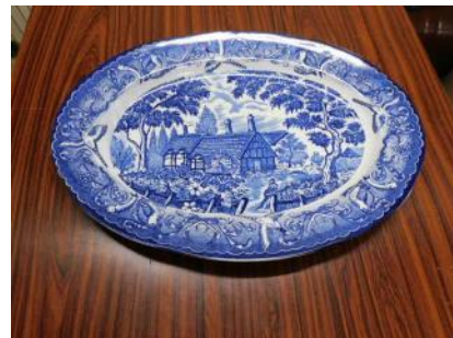
オードブル皿ほか数点