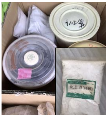
陶芸用粘土・釉薬

昨年8月から、31件出品し、うち25件の品が新たな所有者のもとに引き渡されました。現在、以下の6点が出品中です。