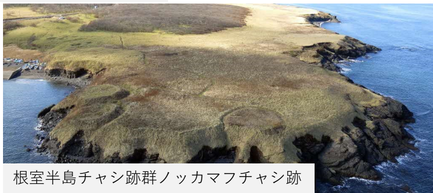
根室半島チャシ跡群ノッカマフチャシ跡