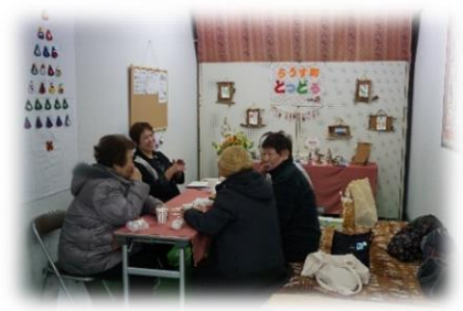
地域サロン運営事業