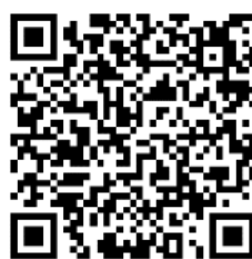
X (旧 Twitter)