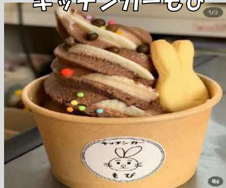
キッチンカーもび