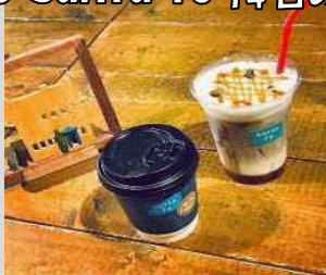
Cafe Santa fe 14日のみ出店