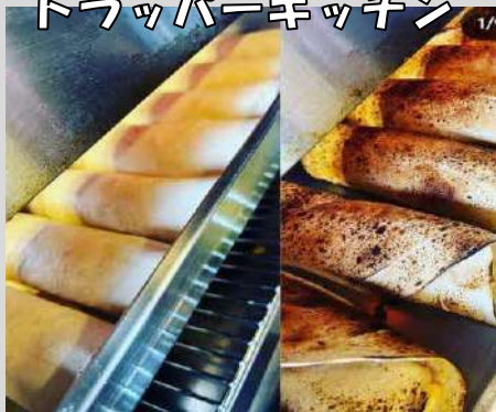
トラッパーキッチン