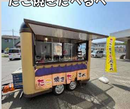
たこ焼きたべるべ