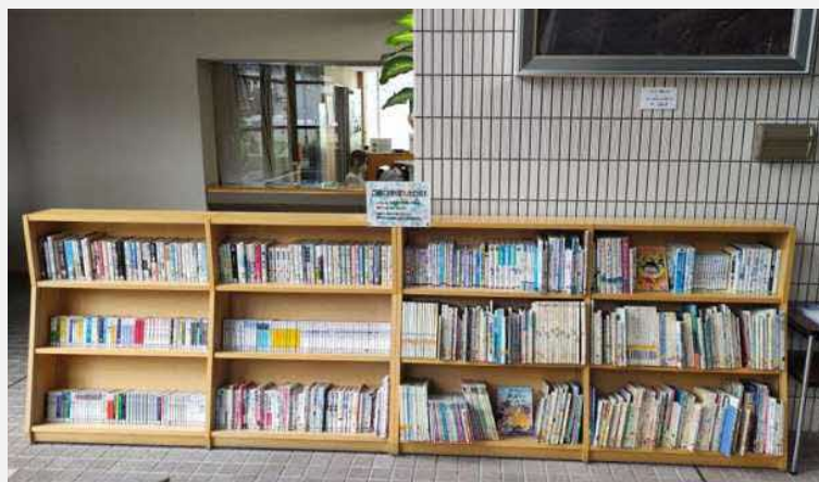
役場ロビーにて実施中です

図書館で除籍した本を町民の皆様へ還元いたします！ お気に入りの本を見つけたらご自由にお持ち帰りください。