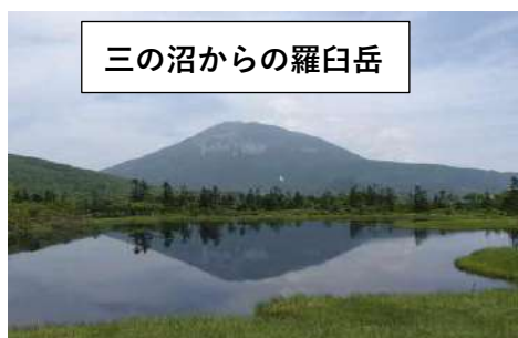
三の沼からの羅臼岳