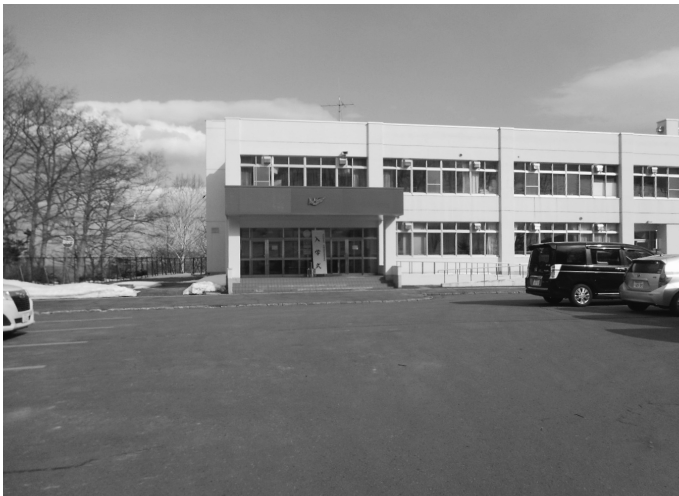
令和4年度羅臼高校入学式