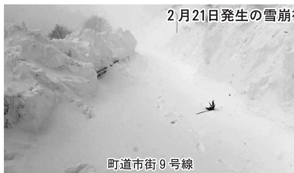
2月21日発生の雪崩被害

さらに、町営住宅緑町団地の雪崩発生箇所については、雪崩予防柵も設置され、明確な発生場所が特定でき