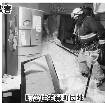
町営住宅緑町団地