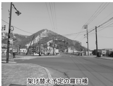
架け替え予定の羅臼橋

道は、令和四年度、再度 用地測量などを実施し、迂 回路の工事、令和五年度か ら橋梁の撤去に着手し、新 橋の完成を令和九年度、橋 梁前後の道路改良を令和十 年度で完成し、同年度に供 用開始を考えているとの事。 一日も早く、安心、安全で 円滑な交通が確保されるよ う町と致しまして事業の 早期完成のため協力してい く。