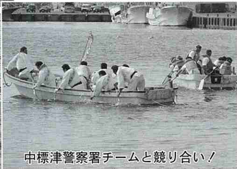
中標津警察署チームと競り合い!