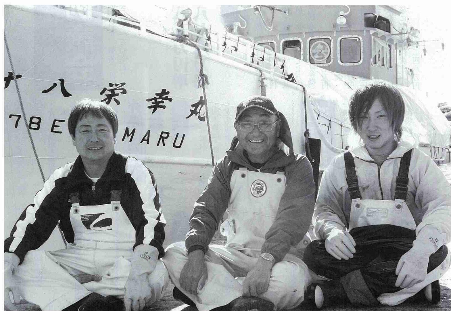
親子3代漁師・ほっけ刺網漁（4月～12月）