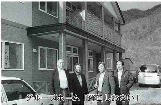
グループホーム「羅臼しおさい」

・診療所経営状況について 四月から九月まで約七千万円赤字であると報告を受けました。今後は支出の削減の検討を期待するところであります。現在、医療プロジェクトチームが診療所の指針を作成している段階なので動向に注視していきます。