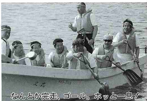
なんとか完走、ゴール。ホッと一息!