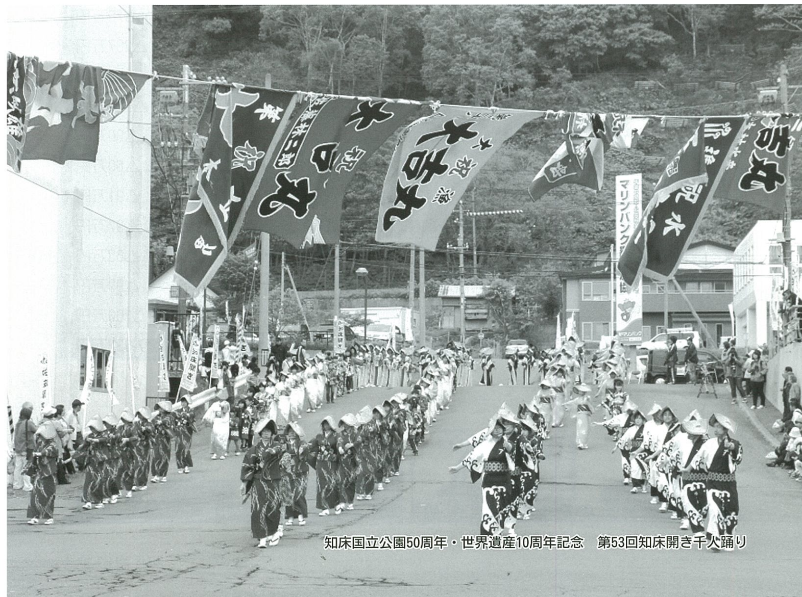
知床国立公園50周年・世界遺産10周年記念 第53回知床開き千人踊り