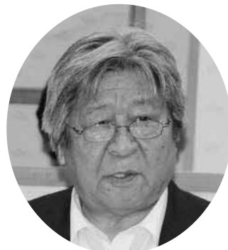
坂本 志郎 議員