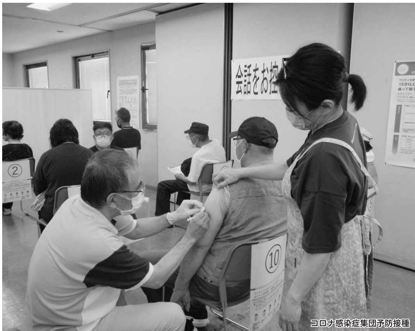
コロナ感染症集団予防接種