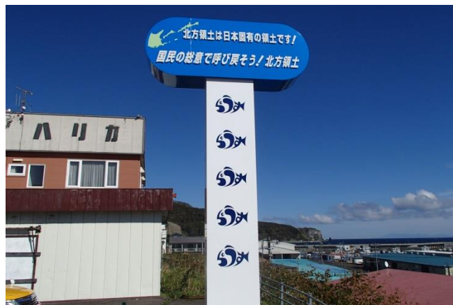
北方領土啓発看板