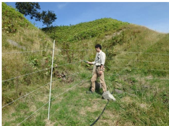
野生鳥獣対策電気柵