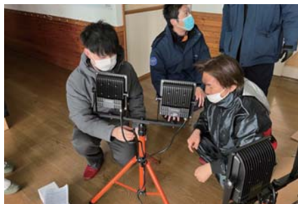
投光器の組立の様子