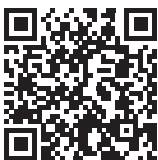
北方領土問題対策協会 YouTube