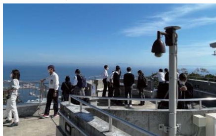
羅臼国後展望塔見学