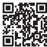
北方領土エリカちゃん Facebook