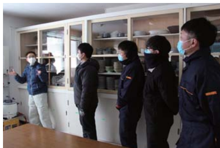
水道、ガスの使用方法の説明

普段使う事の無い防災備蓄品を実際に使用したことで有事の際に、よりスムーズに避難所設営を行えるようになりました。