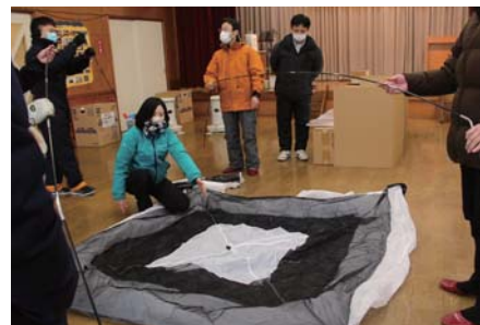
屋内用テントの組立の様子

訓練関係機関：釧路方面中標津警察署羅臼駐在所、第一管区海上保安部羅臼海上保安署、陸上自衛隊標津分屯地第302沿岸監視隊、陸上自衛隊第27普通科連隊第3科、釧路開発建設部中標津道路事務所