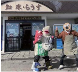
ラウフィッシャーとにじゅまるくん

道の駅前広場で「キッチンカーズマルシェ」を2月18・19、25・26日と2週にわたり、開催しました！当日は沢山の町民のみなさんにお越しいただき、大盛況のうちに終わることが出来ました。道の駅前がにぎわっていると嬉しい気持ちになりましたね(^o^)お越し頂いたみなさんありがとうございました！